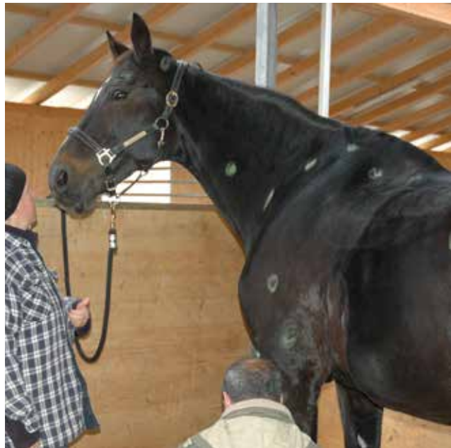
Jedes einzelne Energieschloss weist durch die Bedeutung seiner Zahl und Lage auf ein bestimmtes Thema hin.

Im Jin Shin Jyutsu wird mit 26 sogenannten Sicherheitsenergieschlössern auf der linken Körperseite und identischen Schlössern auf der rechten Körperseite gearbeitet. Die Schlösser bilden energetische Zentren am Körper, die, von einem punktuellen Mittelpunkt